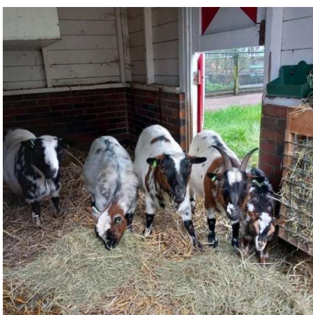
4 generaties ...