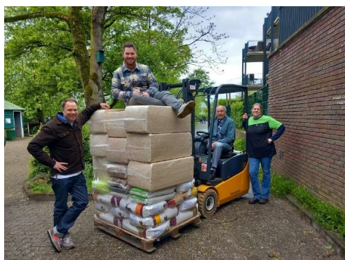
Tafelronde158 met een lading voer

Puzzelen en creatief zijn. Dat was nodig tijdens de KPJ Dorpskwis. Traditioneel neemt Team Zustertuin deel aan deze kwis. Vanuit ons hoofdkwartier 't Uilennest hebben we onder het genot van een hapje en drankje ons gebogen over het kwisboek met vragen. Uiteindelijk leverde het een 33 ste plaats op. Bij een volgende editie zijn we weer van de partij met hopelijk een groot team Zustertuinvrijwilligers.