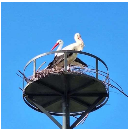
Een echte en nepooievaar in het nest

Eind april konden we twee donaties tegemoet zien. De eerste kwam van Platform-Z. Dit netwerk van zelfstandige professionals in Bodegraven-Reeuwijk bestaat 10 jaar en hield tijdens haar feestavond een loterij waarvan de opbrengst ten gunste van de Zusteruin kwam . Daarnaast kregen we van de Tafelronde 158 Bodegraven-Reeuwijk de donatie die opgehaald is met de kerstbomenactie 2023. Deze opbrengst hebben we direct kunnen omzetten naar drie maanden voer en bodembedekking.