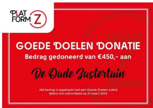
Cheque van Platform-Z