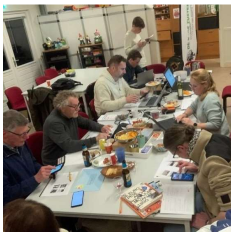
Hier worden hersens gekraakt

Puzzelen en creatief zijn. Dat was nodig tijdens de KPJ Dorpskwis. Traditioneel neemt Team Zustertuin deel aan deze kwis. Vanuit ons hoofdkwartier 't Uilennest hebben we onder het genot van een hapje en drankje ons gebogen over het kwisboek met vragen. Uiteindelijk leverde het een 33 ste plaats op. Bij een volgende editie zijn we weer van de partij met hopelijk een groot team Zustertuinvrijwilligers.