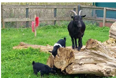
Loes met Jip en Yara