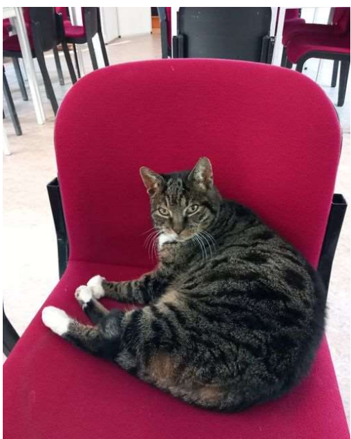
Tijger op zijn zetel

Onze lieve boerderijkat Tijger is 23 april 10 jaar geworden! De DAP Bodegraven, heeft hem een seniorengezondheidscheck gegeven. Tijger is nog steeds gezond en kijkt hem tevreden liggen