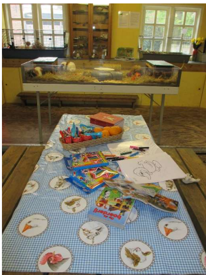
Knuffeluurtje lang geleden in de Hooiberg

Het 10-jarige bestaan hebben we natuurlijk gevierd. Het knuffeluurtje is op woensdagochtend waar jonge kinderen op een laagdrempelige manier met dieren en hun verzorging kennis maken. Ook voor de (groot-)moeders en (groot-)vaders blijft het een gezellige activiteit.