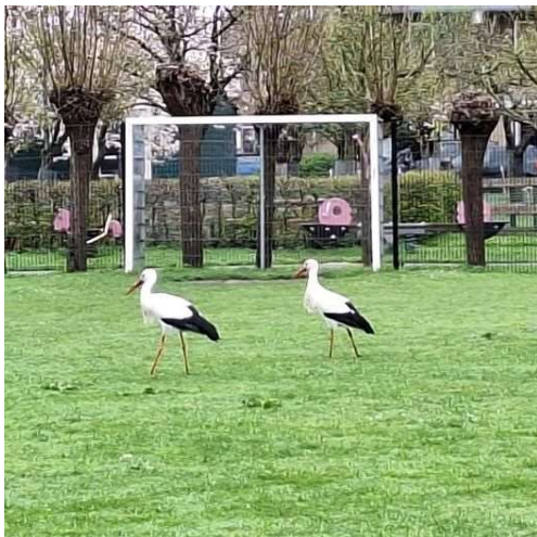
Ooievaars op het veld