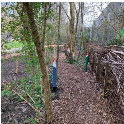
Kabouterpad met nieuwe paaltjes

Jaarlijks doen wij mee aan NLDoet van het Oranjefonds. NLDoet is een landelijk project waarbij mensen deel kunnen nemen aan vrijwilligerswerkzaamheden. Dit jaar hebben we aandacht gegeven aan het groen. Er zijn een kleine 100 struikjes geplaatst om kalere stukken op te vullen. Het kabouterpad heeft de periodieke onderhoudsbeurt gehad. Er zijn nieuwe houtsnippers gestort en er zijn nieuwe kabouterpaaltjes geplaatst. Ook is er een hek neergezet tussen het kabouterpad en de nieuwe aanplant met als doel de doorloop vanaf het voetpad naar het kabouterpad te beperken, zodat de verse struiken de kans krijgen aan te slaan.