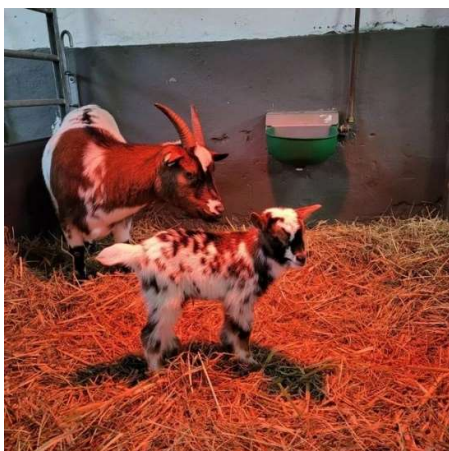
Bambi en Britt