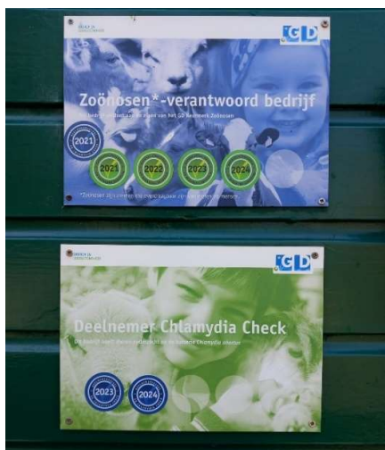
Keurmerken GD aan de Hooiberg

Ieder jaar horen we of de keurmerken van de GD (Gezondheidsdienst Dieren) weer aan ons zijn toegekend, nadat een veearts een checklist naloopt. We ontvingen goed nieuws en hiermee is aangetoond dat we er alles aan doen om te voorkomen dat mensen ziek kunnen worden van de dieren (zoönose: ziektes die overgaan van dieren op mensen).