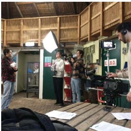
TV opnames Waku Waku

De Hooiberg was ineens een Tv-studio. Op 18 maart zijn er opnames gemaakt voor het educatieve kinderprogramma Waku Waku. Wij vonden het heel leuk om mee te maken. Onze witte chinchilla en een haan komen in het najaar op televisie. We weten nog niet wanneer.